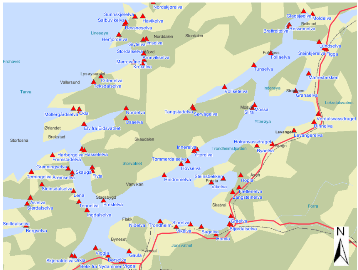
Figur 3: Lakse- og sjørretelver i Trøndelag rundt Trondheimsfjorden.